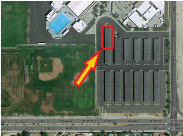
Preparatoria de Desert Hot Springs - Miercoles